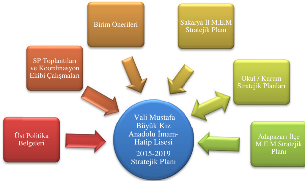
Şekil 1: Vali Mustafa Büyük Kız Anadolu İmam Hatip Lisesi 2015-2019 Stratejik Planı Oluşum Şeması

Stratejik Plan çalışmalarını yönlendirmek ve Müdürlüğümüz stratejik amaç ve politikalarının belirlenmesine, hizmet ve kurumsal gelişimine yardımcı olmak üzere Okul Müdür yardımcısı başkanlığında, Rehber öğretmen ve bir branş öğretmenin yer aldığı üst yönetimden oluşan “Vali Mustafa Büyük Kız Anadolu İmam Hatip Lisesi Stratejik Plan Üst Kurulu” oluşturulmuştur.