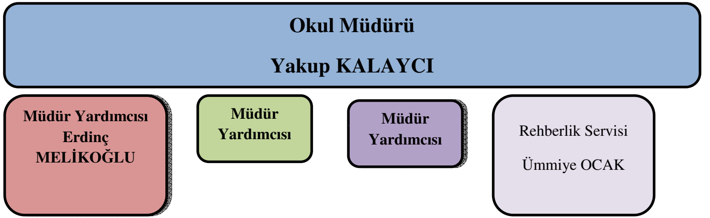
Şekil 3: Adapazarı Vali Mustafa Büyük Kız Anadolu İmam Hatip Lisesi Müdürlüğü Teşkilat Şeması

Vali Mustafa Büyük Kız Anadolu İmam Hatip Lisesi Müdürlüğü teşkilat yapısı aşağıdaki gibidir.